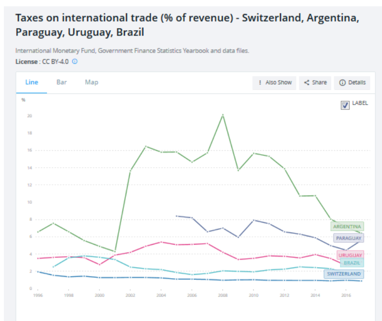
Figure 2: https://data.worldbank.org/share/widget?end=2017&indicators=GC.TAX.INTT.RV.ZS&locations=CH-AR-PY-UY-BR&start=1996&view=chart

Sobre la base de la experiencia de otros países, cabe esperar que la reducción del gasto público se produzca después de la reducción de los aranceles, incluso en los servicios públicos, como la infraestructura, los servicios de salud o las guarderías, de los que las mujeres tienden a depender más que los hombres. 103 Tal disminución de los ingresos gubernamentales, si se traduce en una menor asignación de recursos para el gasto social, es contraria al deber de los gobiernos de movilizar recursos para la realización